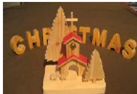
チャペルとヒツジ