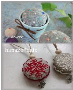
Petit Lapin カルトナージュ・布小物