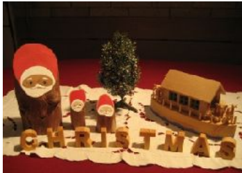
CHRISTMASの文字とノアの方舟