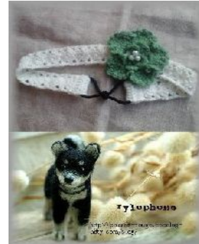
+fluffy choco*anna 布小物