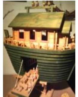
大きなノアの方舟～動物がいっぱい乗っています

＜作家プロフィール＞ ・ウッドクラフトの制作と展示 ・山梨鳴沢村にギャラリー開設