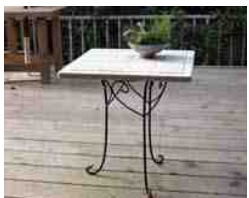
45cm角のミニテーブル