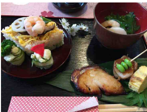
昨年のおいしいお雑さま料理