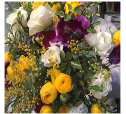
イースターのブーケイメージ